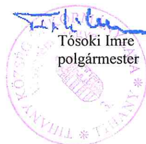
Tósocki Imre polgármester